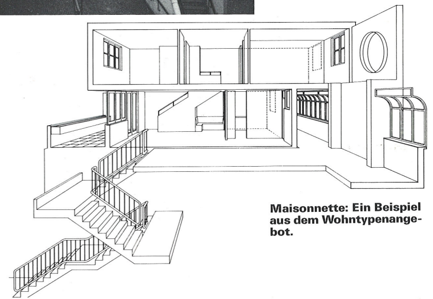
Maisonnette: Ein Beispiel aus dem Wohntypenangebot.