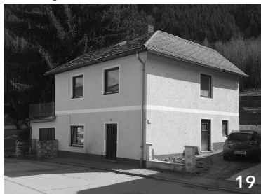
Leerstand, Fenster zugeklebt