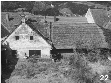
ungenutzt, möglicherweise einsturzgefährdet