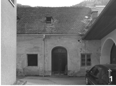
Garage, genutzt von einem Motorrad