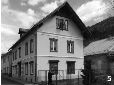
möglicherweise unbewohnt (Decke im Fenster)