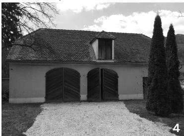
gehört zum Gebäude davor, innen leer, alte Garage