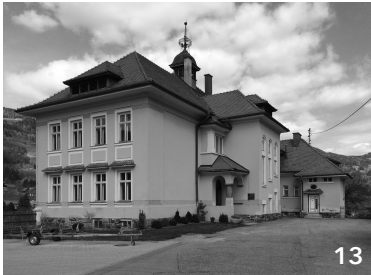
13 ehemalige Haushaltsschule, scheint unbenutzt