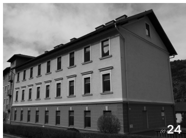
14 leerstehende Wohnungen