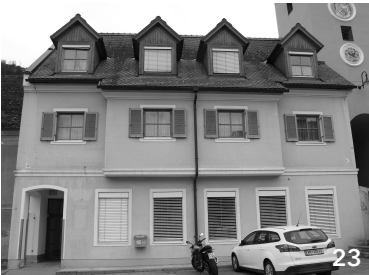
im EG Asfinag (3Jahre), gehört Gemeinde im OG befinden sich Wohnungen