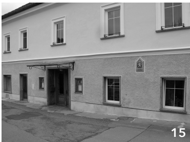
15 Gasthaus unbenutzt