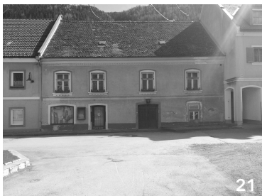
Erdgeschoß wirkt unbewohnt/ungenutzt