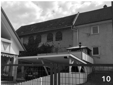
schließt an Gebäude 9 an, alter Stall, möglicherweise ungenutzt