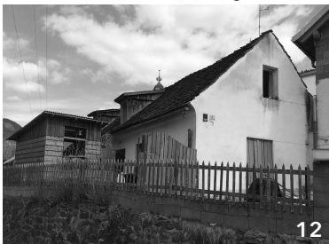
unbewohnt, stark sanierungsbedürftig