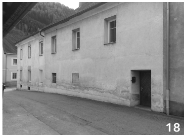
EG ungenutzt, OG möglicherweise bewohnt