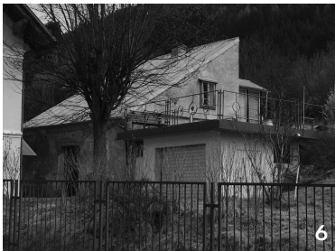
möglicherweise unbewohnt im EG befindet sich eine genutzte Garage