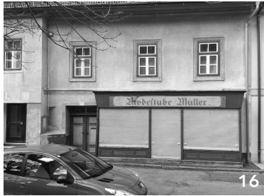
Fötschl + Modestube - Müller, leerstand