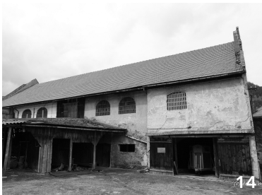
14 Stall ungenutzt, einsturzgefährdet