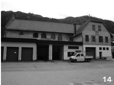
14 Garagen vor Stadl genutzt von der Feuerwehr