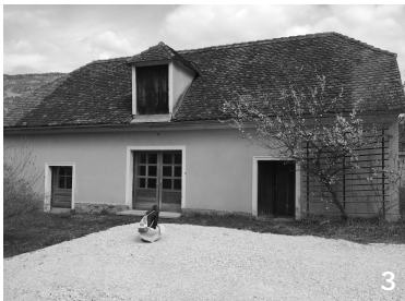
gehört zum Gebäude davor (neuer Innenpool)