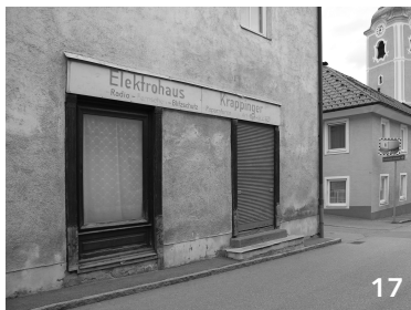
EG ungenutzt, OG möglicherweise bewohnt